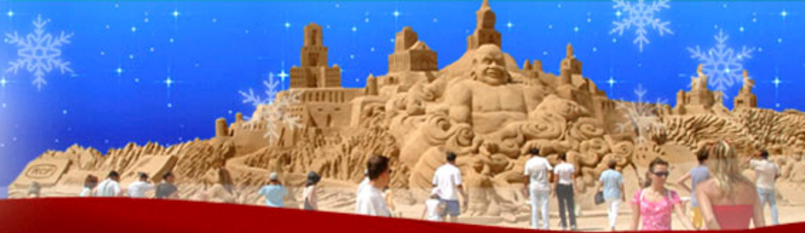
Ek – 2 : Sponsorluk logo ve heykel çalışmalarından örnekler;